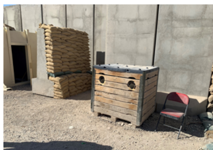
Afbeeldingen 2 en 3: Laad- en ontlaadinrichtingen parkeerplaats (links) en ingang Camp Bulldog (rechts).