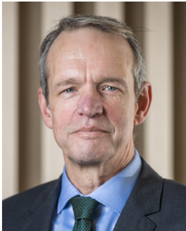
De Inspecteur-Generaal Veiligheid, Wim Bargerbos

De IVD hoopt met dit rapport handvatten te bieden om de benodigde verbeteringen vorm te geven. Zij bedankt alle betrokkenen voor hun constructieve medewerking aan het onderzoek.